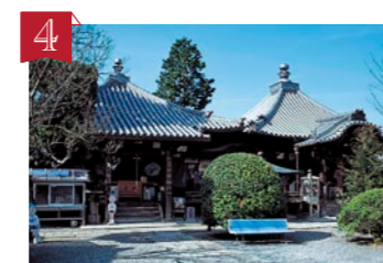
4 第73番札所 出釋迦寺 (しゅつしゃかじ) 我拝師山にある奥の院から稚児大師像を目指して岩場を登っていくと、7歳の空海が「仏門に入り、多くの人を救いたい」と身を投げたといわれる場所があります。 ▶善通寺市吉原町1091