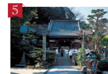
5 第74番札所 甲山寺 (こうやまじ) 空海が毘沙門天の像を岩窟においたのが甲山寺のはじまり。また、境内の各所にさまざまな表情をしたウサギが見られ、「ウサギのお寺」とも呼ばれています。 ▶善通寺市弘田町1765-1