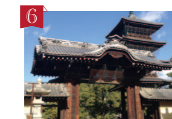
6 第75番札所 善通寺 (ぜんつうじ) 弘法大師 空海の御誕生地。寺の名前は、空海の父「佐伯善道」から名付けられました。東院と西院に分かれていて、見どころがたくさんあります。 ▶善通寺市善通寺町3-3-1