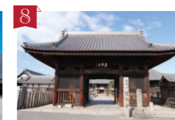
8 第77番札所 道隆寺 (どうりゅうじ) 和氣道隆が誤って乳房を射たことから供養のため建立。空海が薬師如来を刻み本尊とし、眼病には霊験あらたかと伝えられています。 ▶仲多度郡多度津町北鴨1-3-30