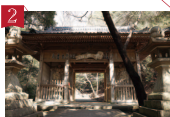
2 第71番札所 弥谷寺 (いやだにじ) 空中から五柄の剣が下がったということで、千手観音の像を刻んで剣五山弥谷寺と名づけられました。阿弥陀三尊などが刻まれた岩壁は有名。 ▶三豊市三野町大見70