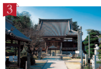
3 第72番札所 曼荼羅寺 (まんだらじ) 四国霊場で最古の開創を誇るお寺。中国から帰国した空海が本尊に大日如来をまつり、曼荼羅をおさめたことによりこの名前がついたそうです。 ▶善通寺市吉原町1380-1