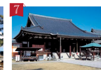
7 第76番札所 金倉寺 (こんぞうじ) 安産や子育てなど女性を守ってくれる神様・訶梨帝母尊(かりていもせん)、通称「おかるてんさん」がいるお寺。ザクロの香りのするお香や絵馬が人気です。 ▶善通寺市金蔵寺町1160